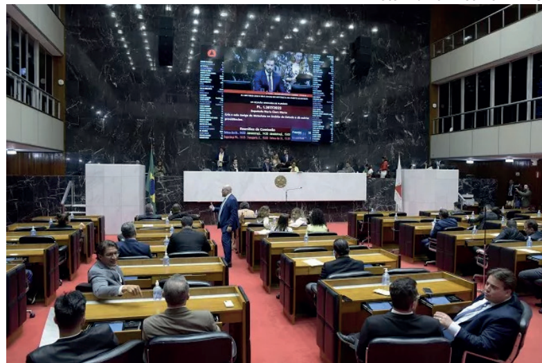
A lei facilita a implementação da tecnologia de quinta geração (5G) nas áreas interiores do estado.

A lei facilita a implementação da tecnologia de quinta geração (5G) nas áreas interiores do estado, promovendo a modernização das infraestruturas de telecomu-