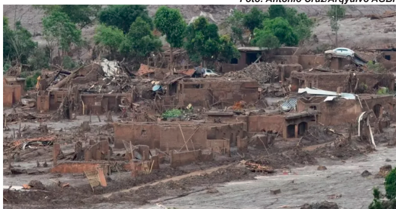
Rompimento da Barragem de Fundão, em Mariana (MG).

“Os municípios não foram incluídos na mesa de negociação, embora sejam autônomos pela Constituição. E também não achamos justa a forma pela qual o acordo foi imposto para o Estado de Minas Gerais. Se todos os municípios foram impactados, mesmo que não