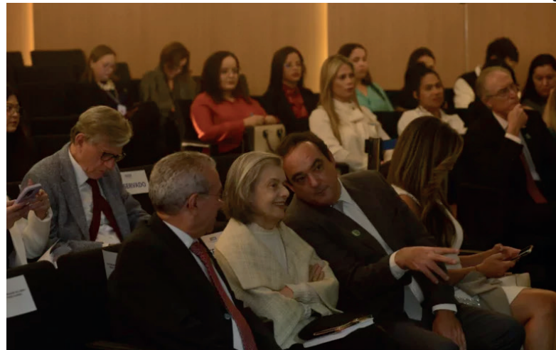
A palestra ministrada pela ministra Cármen Lúcia tratou da “Constituição Brasileira e a Proteção ao Trabalho Rural”.

falou sobre a importância da valorização dos profissionais e destacou um desafio enfrentado por diversos setores para atrair mão de obra qualificada. “Há uma grande dificuldade de despertar interesse nas novas gerações para uma série de profissões que existem porque as pessoas não se sentem valorizadas naquelas profissões”, completou. Em seguida, o evento contou com 5 palestras e uma mesa redonda que debateu os desafios constitucionais e trabalhistas no âmbito do direito e da agroindústria. Já as palestras trataram de questões como direito