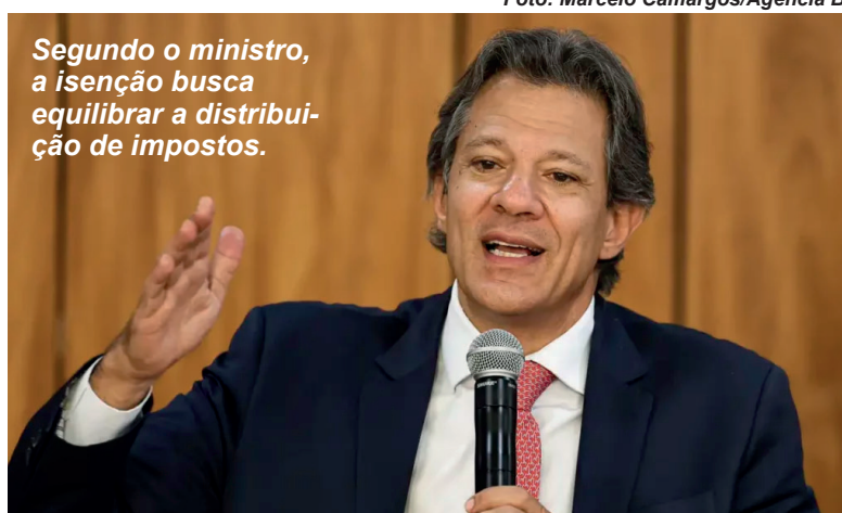
Segundo o ministro, a isenção busca equilibrar a distribuição de impostos.

ministro em pronunciamento em cadeia nacional de rádio e de televisão. Segundo Haddad, a medida faz parte da segunda etapa da reforma tributária, que prevê a reforma do Imposto de Renda. No pronunciamento, de acordo com a Agência Brasil, o ministro lembrou da reforma tributária do consumo, promulgada no ano passado e em regulamentação pelo Congresso, que trará outros benefícios às classes baixa e média.