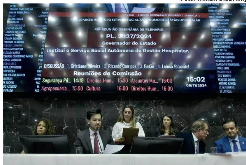
Os eleitos ficam no cargo de fevereiro de 2025 a janeiro de 2027.

A eleição da Mesa Diretora da Assembleia Legislativa de Minas Gerais (ALMG), que ocorre nesta quarta-feira, às 10h, é um evento central para definir a liderança do Poder Legislativo mineiro no segundo biênio da 20ª Legislatura, de fevereiro de 2025 a janeiro de 2027. Ela é composta pelo presidente da Casa, o 1º, o 2º e o 3º-vice-presidentes e o 1º, o 2º e o 3º-secretários. As chapas interessadas em concorrer ao pleito podem ser registradas até as 8 horas da manhã desta quarta. A eleição é em votação aberta, com o registro de cada voto no painel eletrônico do Plenário. O resultado