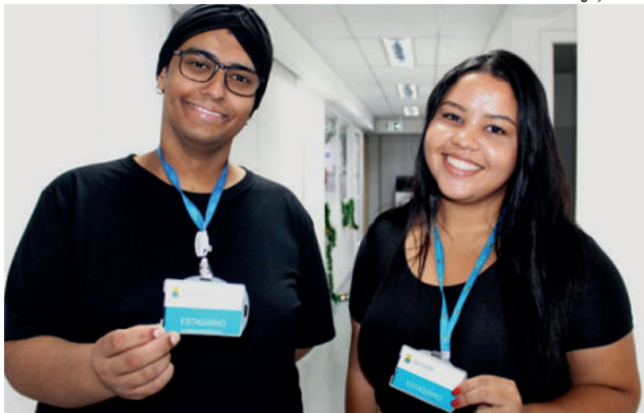
A Prefeitura de Belo Horizonte (PBH) disponibilizou, em setembro, 214 vagas no Banco de Estágios 2025.

O cadastro só é validado após o preenchimento com-