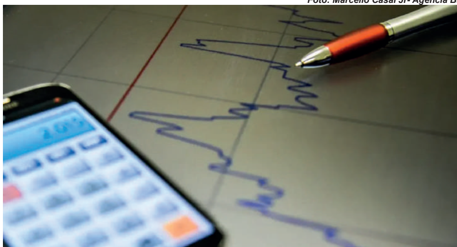
No acumulado dos últimos 12 meses, o IPCA-BH soma alta de 3,84%.

No sentido contrário, ajudaram a conter a inflação as quedas nos preços das passagens aéreas (-19,36%), móveis para quarto (-4,39%) e câmeras digitais (-9,77%). No acumulado dos últimos 12 meses, o IPCA-BH soma alta de 3,84%, enquanto o IPCR-BH acumula 3,58%. Os dados indicam pressão maior sobre o orçamento das famílias de menor renda, especialmente com a elevação de preços em itens essenciais.